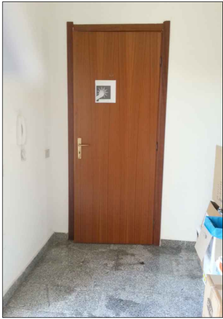
foto 3 - infissi esterni